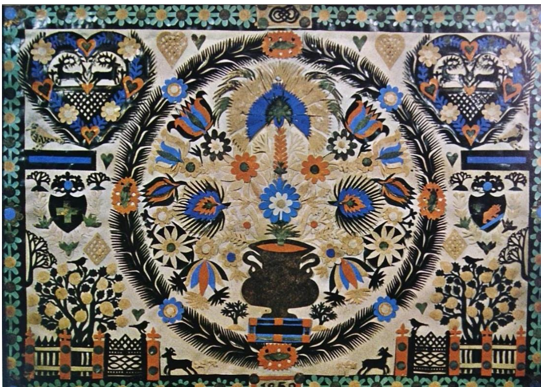
Foto: Scherenschnitt von Johann Jakob Hauswirth (Privatarchiv H.P. Gautschin)